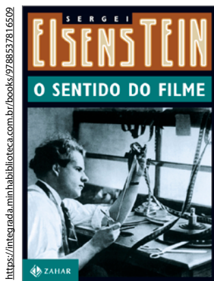
https://integrada.minhabiblioteca.com.br/books/9788537816509 O SENTIDO DO FILME EISENSTEIN, Sergei ISBN: 9788537816509 Zahar LITERATURA E CINEMA