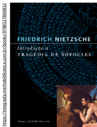
https://integrada.minhabiblioteca.com.br/books/9788537806852 INTRODUÇÃO À TRAGÉDIA DE SÓFOCLES NIETZSCHE, Friedrich ISBN: 9788537806852 Zahar INTRODUÇÃO AOS ESTUDOS CLÁSSICOS